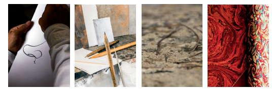
CARICATURE GRAVURE PAPIER RELIURE