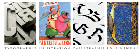
TYPOGRAPHIE ILLUSTRATION CALLIGRAPHIE ENLUMINURE